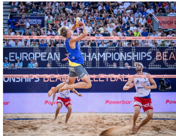
David Åhman och Jonatan Hellvig