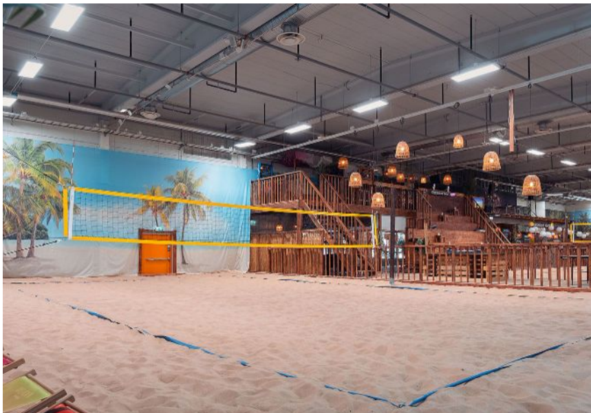
Inspirationsbild ifrån Stockholm