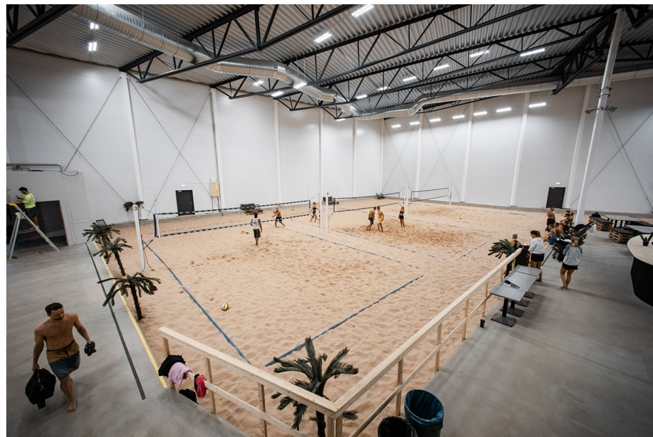
The beach i Huddinge