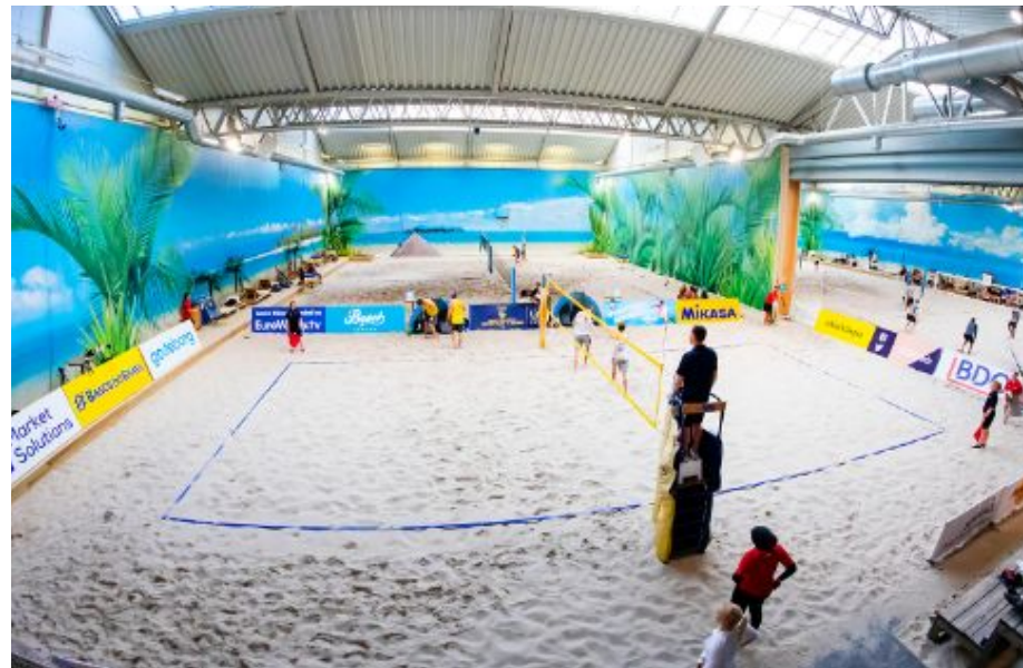
Inspirationsbild ifrån Göteborg